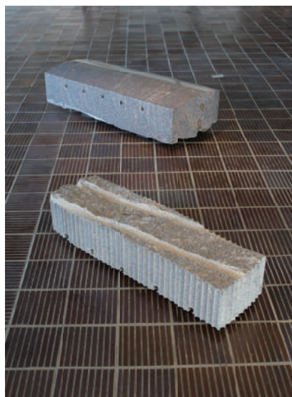
< 時のカプセル・内と外12 > 2022年

会場 アンフォルメル中川村美術館 期間 2023年 8月26日(土)～9月18日(月/祝) 〒399-3801 長野県上伊那郡中川村大草2124番地 / 電話：0265-88-2680 [開館時間] 10:00-17:00 [休館] 火・水曜日 [入館料] 400円 ※詳しくはwebをご覧ください。 www.informelmuseum.com