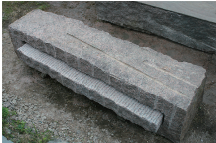
< 時のカプセル・内と外4 > 2014年