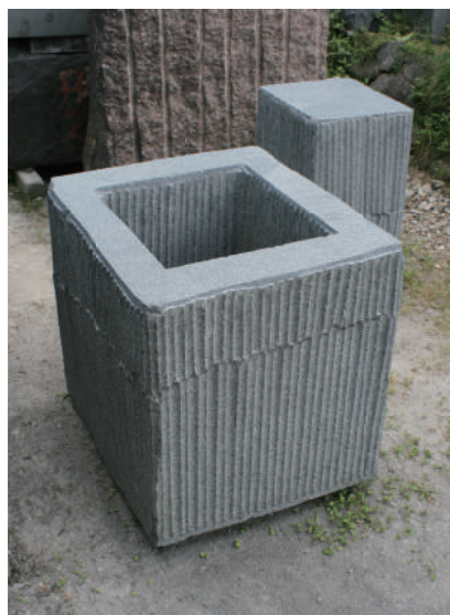
< 時のカプセル・内と外2 > 2012年